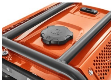
Tapón de combustible externo para reabastecimiento de combustible

Tapón de combustible externo para reabastecimiento de combustible fácil